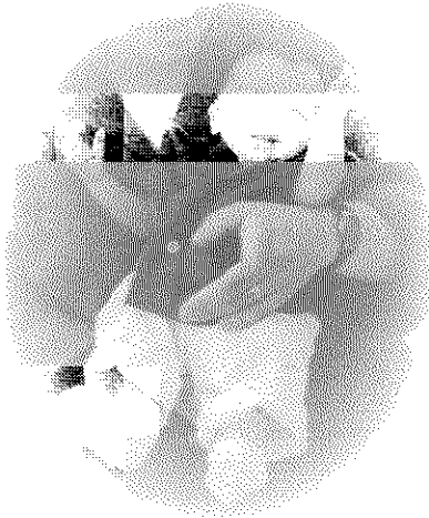
Nerea Torrente 30 de juny del 97